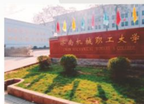
东校区（原济南机械职工大学）